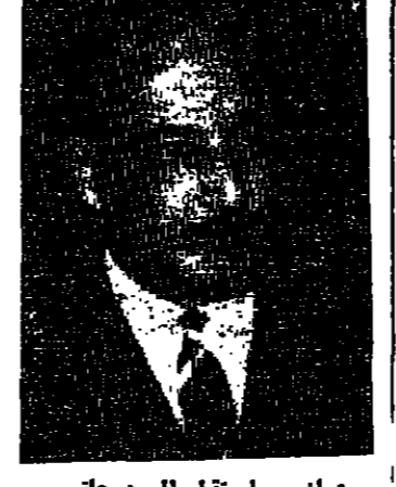
الاجتماع مع وزير الاقتصاد

اجتمع وزير الاقتصاد بمجلس غرفة الصناعة عمان - استقبل السيد حاتم الزعبي وزير الاقتصاد الوطني في مكتبه أمس رئيس واعضاء مجلس ادارة غرفة الصناعة عمان، وقد جرى في هذه المقابلة استعراض عدد من القضايا التي تهم نطق الترتيب الخاص بمقعد اجتماعات مشتركة بصورة منتظمة لتبادل الآراء حول المواضيع التي تتكسب بالصناعة الأردنية. كما جرى استعراض بعض القضايا المهمة لظهور القهضة الصناعية الأردنية بالاشتراك في المعارض العربية والدولية والتسويق الجوهرة والتي يمكن الحصول عليها نتيجة لذلك.